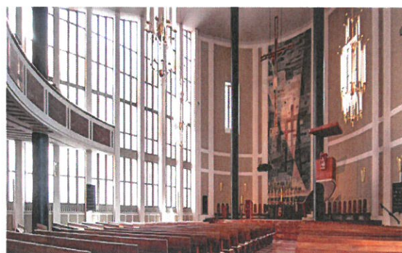
St. Matthäus.de München

Anmeldung ist bis spätestens 15. September im Pfarrbüro der Pfarreiengemeinschaft Peißenberg/Forst erforderlich!